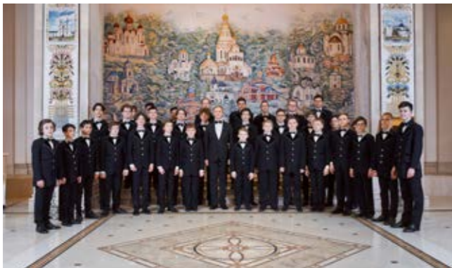
ХОР МАЛЬЧИКОВ И ЮНОШЕЙ ИМЕНИ И.А.ЖУРАВЛЕНКО РЕСПУБЛИКАНСКОГО МУЗЫКАЛЬНОГО КОЛЛЕДЖА (Минск, Республика Беларусь)