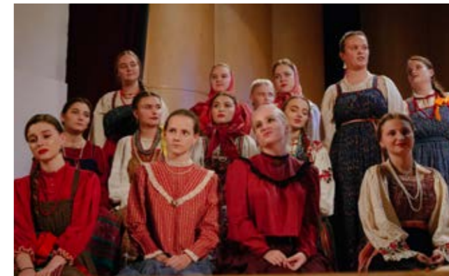
СВОДНЫЙ ФОЛЬКЛОРНЫЙ АНСАМБЛЬ КАФЕДРЫ ХОРОВОГО И СОЛЬНОГО НАРОДНОГО ПЕНИЯ РАМ ИМЕНИ ГНЕСИНЫХ

Коллектив является активным участником городских и областных мероприятий. В ноябре 2021 года Фольклорный ансамбль «Сашенька» стал Лауреатом 1 степени на III Всероссийском конкурсе народно-певческого искусства им.Родыгина, состоявшегося в Екатеринбурге.