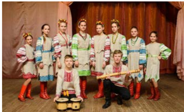
ДЕТСКИЙ ФОЛЬКЛОРНЫЙ АНСАМБЛЬ «ЛАДУШКИ»