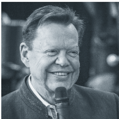
ПРЕЗИДЕНТ ОБЩЕСТВА «ИНТЕРКУЛЬТУРА» (ГЕРМАНИЯ)