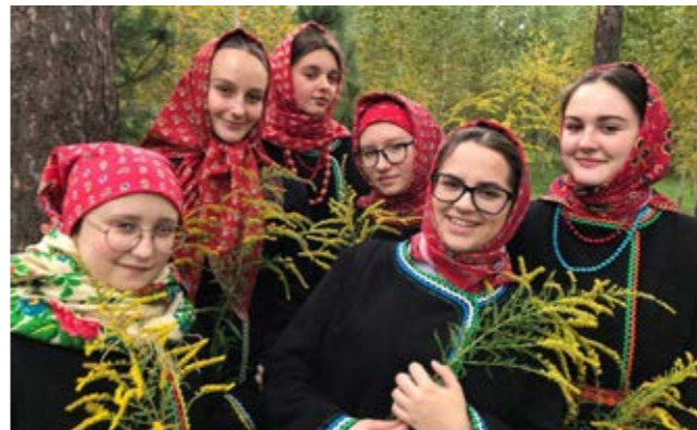
ФОЛЬКЛОРНЫЙ АНСАМБЛЬ «САШЕНЬКА» ТУЛЬСКОГО КОЛЛЕДЖА ИСКУССТВ ИМЕНИ А.С.ДАРГОМЫЖСКОГО

Ансамбль «Ладушки» не только изучает традиционную культуру своего региона, сохраняет и популяризирует, но и импровизирует с звучанием этнографии с современными ритмами, с различными направлениями в музыки. В репертуаре ансамбля сказка-притча «Кривда и Правда», сказки под оркестр совместно с ОРНИ «Тула» «Морозко» и «Джаз Теремок», концертные программы о народных праздниках «Масленица» и «Пришла, Коляда», концертные номера.