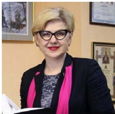
МИНИСТР КУЛЬТУРЫ ТУЛЬСКОЙ ОБЛАСТИ Т.В. РЫБИНА

Сегодня в Тульской области наблюдается Ренессанс хорового искусства, поэтому неслучайно, что эта представительная конференция Ассоциации народных и хоровых коллективов Российского музыкального союза во второй раз проходит у нас.